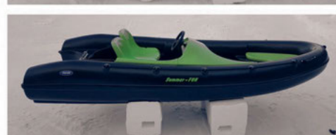
Black line varianter